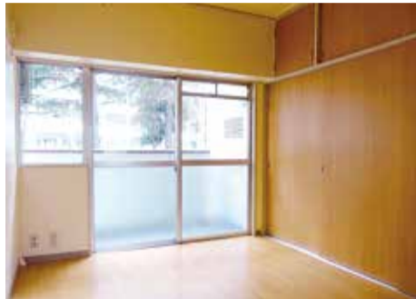
本牧・ポートハイツ洋室イメージ (写真は13号棟洋室)

これまで本牧・ポートハイツ十三号棟において十六室施工し、おかげさまで満室となりました。今年度は、この洋室化工事を十五号棟において五室施工いたします。