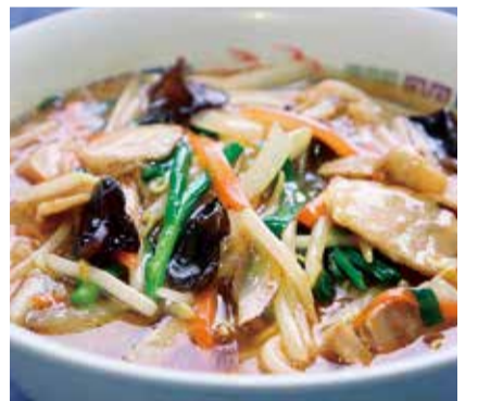
冬のお勧め サンマーメン

また、お部屋の内見申し込みや家賃等は、改めて協会ホームページにて公開いたします。