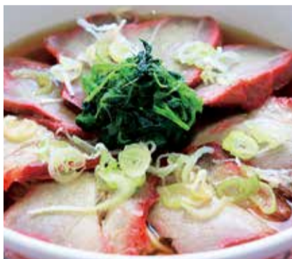
冬のお勧め チャーシューメン

まずは、波止場食堂自慢のチャーシューメン(六三〇円)。波止場食堂の各店で焼いた特製のチャーシューが麺の上に八枚並び、真ん中にほうれん草が乗った満足度の高い一品です。また、横浜名物のサンマーメンも寒い冬にお勧めのメニューです。波止場食堂のサンマーメンは、モヤシ、豚肉、ニラ、玉ねぎ、にんじん、キクラゲの六種類が絡んだ餡が醤油ラーメン